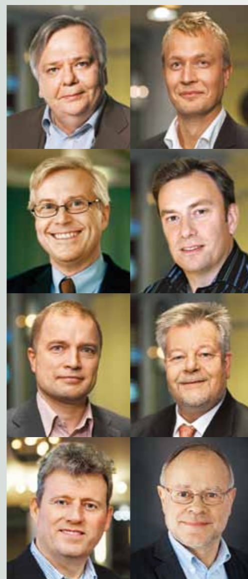
MTD:s styrelse, överst från vänster: