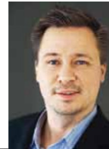
Ricard Tellander, Produktion